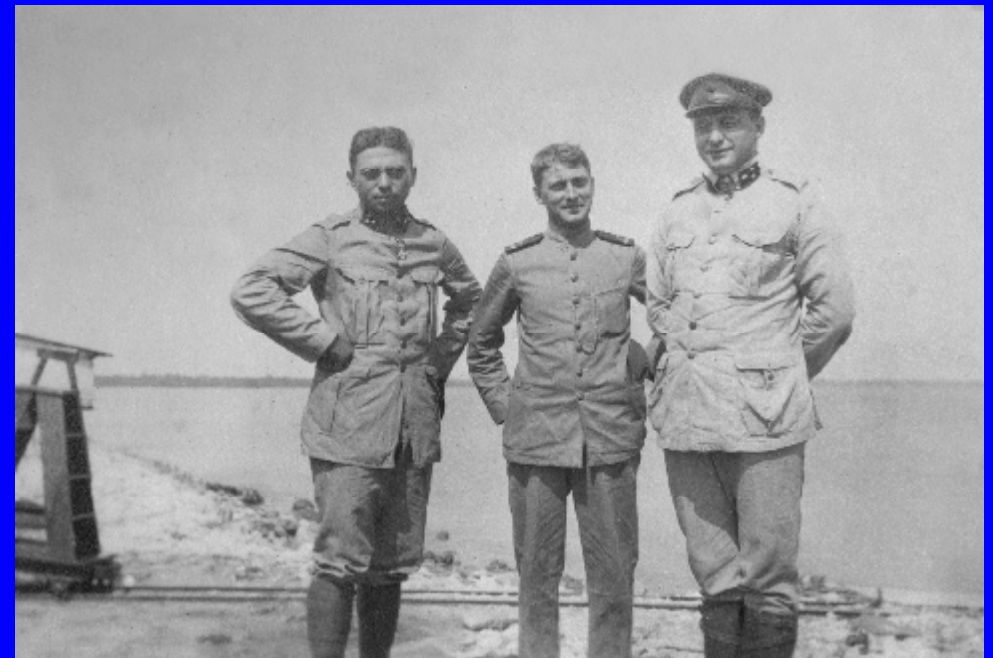
Foto gemaakt in Tandjong Priok op 28 juli 1917 uit een fotoalbum uit 1917.

Alles over de Traditiekamer MLD vindt u op onze website www.traditiekamerMLD.nl