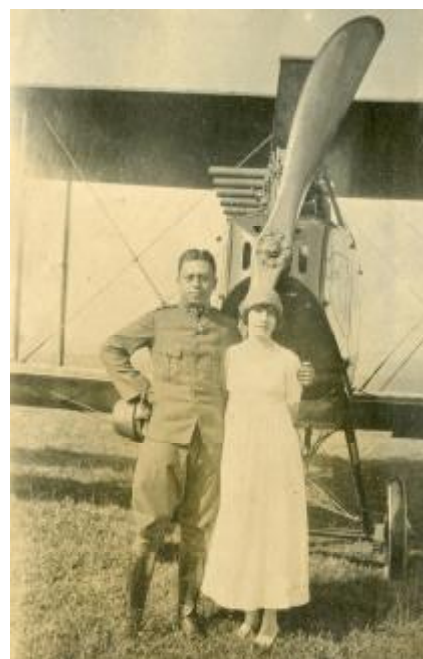
23 aug 1917 Kalichati.

Het album bereikt ons op 30 december en wat gelijk opvalt is dat het lezen van de bijschriften lastig is omdat de zwarte inkt soms is vervaagd, de achtergrond is ouderwets donkergroen, en wat ook al niet helpt is dat het handschrift van de penvoerder niet altijd even duidelijk is. Dat wordt dus puzzelen... Wel levert het doorbladeren een mooi inzicht in het leven van ons koloniale verleden. Het is ook bijzonder een bijna honderd jaar oud boek in handen te hebben en deelgenoot te worden van het huishouden, werk en kennissenkring van de hoofdpersonen, waaronder een aantal prominenten.