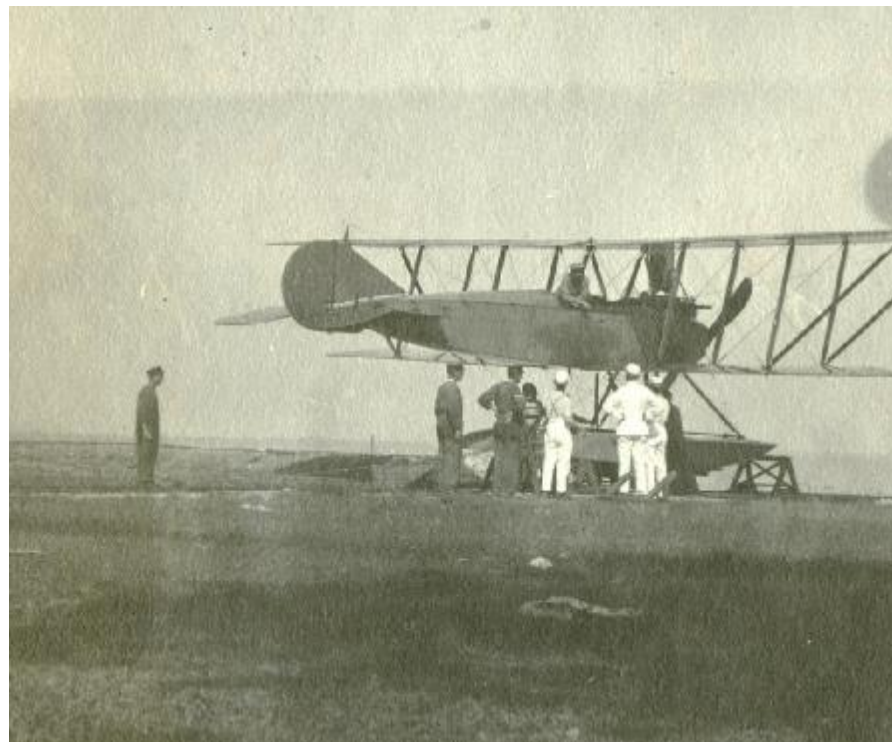
23 july 1917Tandjong Priok Glen Martin Hydra.